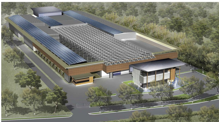
Usine de tri et compostage du Broc

De plus, la directive européenne de novembre 2008 demande aux états membres «de prendre des mesures pour encourager la collecte séparée des bio déchets à des fins de compostage» (art 22) et les députés Européens ont voté le 6 juillet 2010 pour que la commission prenne une directive spécifique «qui rendrait le tri sélectif des bio déchets obligatoire».