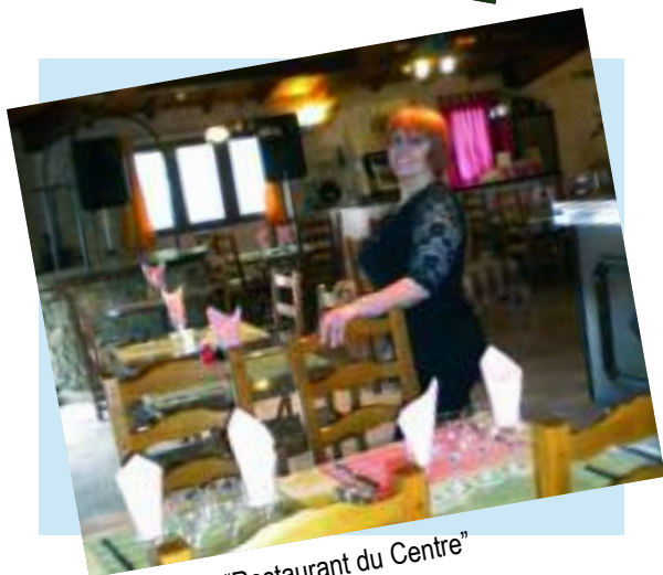
"Restaurant du Centre"