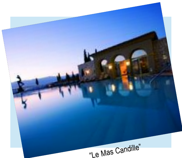
"Le Mas Candille"

L'association des commerçants de la Roquette a organisé sa tombola gourmande du 9 au 15 avril dernier ; une tombola où les heureux gagnants bénéficiaient d'un dîner pour deux offert par le "Mas Candille", pour le 1 er prix, et par les restaurateurs roquettans pour les prix suivants.