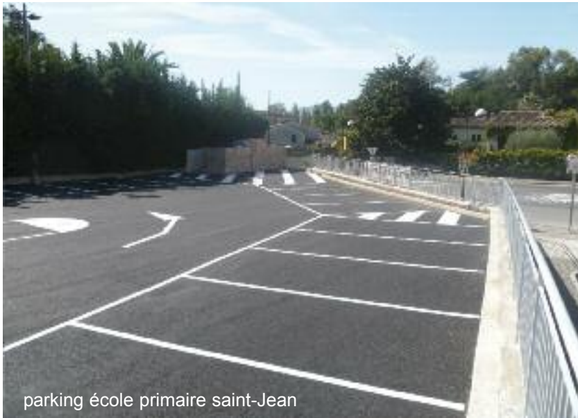
parking école primaire saint-Jean

Il convient de faire une première constatation, La Roquette souffre d'un manque chronique de parkings publics.