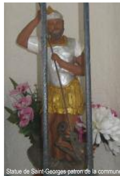
Statue de Saint-Georges patron de la commune