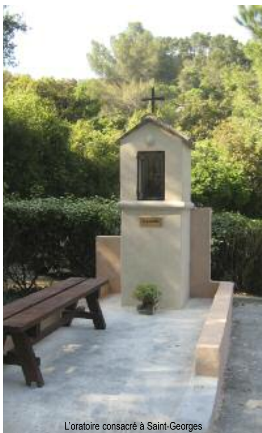
L'oratoire consacré à Saint-Georges