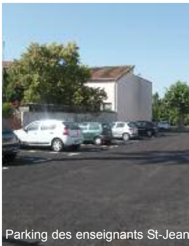
Parking des enseignants St-Jean

Le partage de l'espace public entre les besoins des particuliers et du service public doit donc faire l'objet d'un consensus, la journée priorité à l'accès aux services publics et aux commerces, la nuit pour les particuliers... équilibre pas toujours facile à trouver.