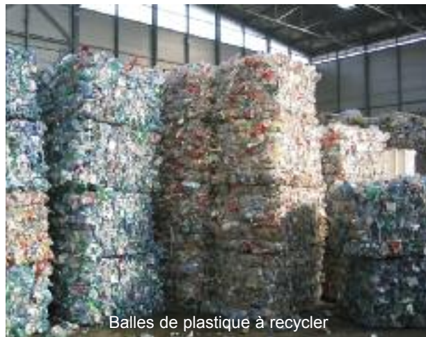
Balles de plastique à recycler

Economique, écologique, le tri est une action simple à réaliser. Utilisez les divers moyens mis à votre disposition pour améliorer le recyclage et diminuer ainsi notre facture. La collectivité vous remercie de cet acte éco citoyen.