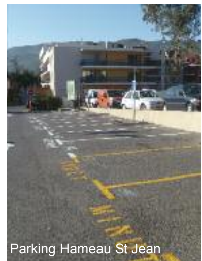
Parking Hameau St Jean