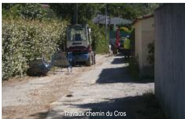
Travaux chemin du Cros