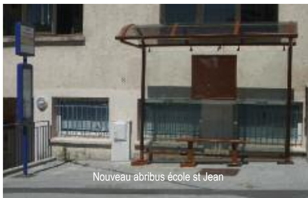
Nouveau abribus école st Jean

A la demande des parents d'élèves, un abribus a été installé devant l'école.