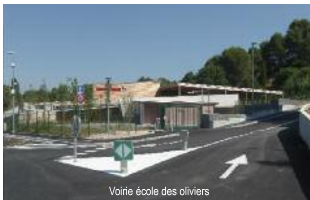
Voirie école des oliviers