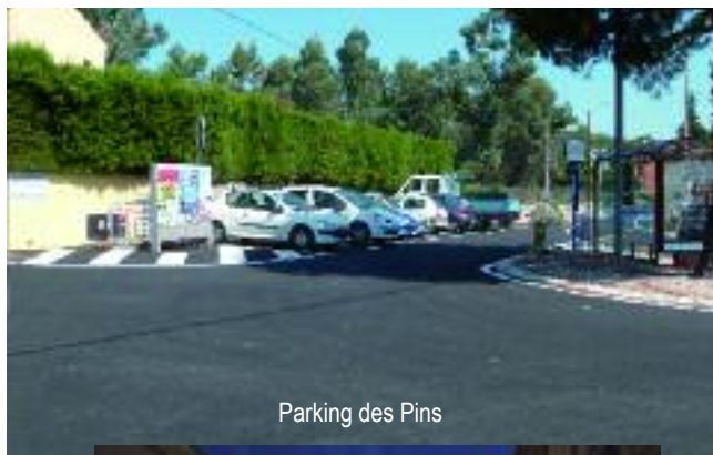
Parking des Pins

Coût 115 000 € pour le Conseil général et 5 000 € pour la mairie.