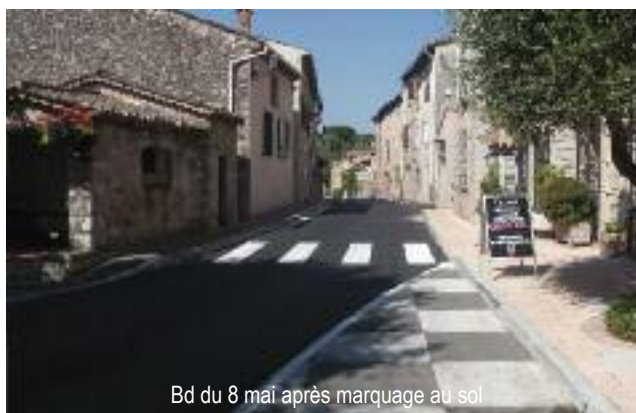
Bd du 8 mai après marquage au sol