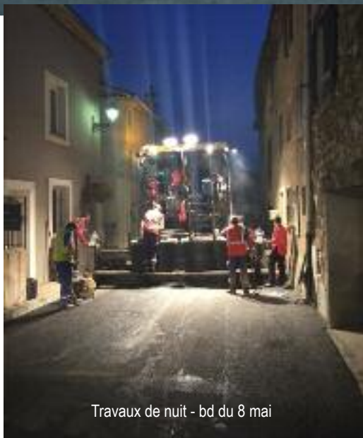
Travaux de nuit - bd du 8 mai