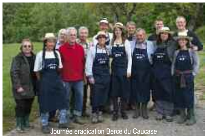
Journée eradication Berce du Caucase