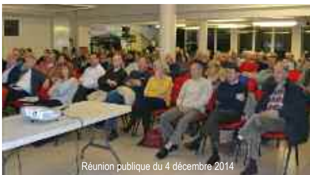
Réunion publique du 4 décembre 2014

Un registre d'observations destiné à recueillir vos observations sur l'avancement du PLU ou plus spécifiquement sur le projet village est ouvert au service urbanisme.