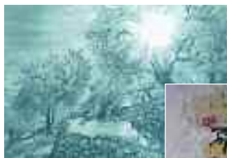
René Bonvalot, graveur