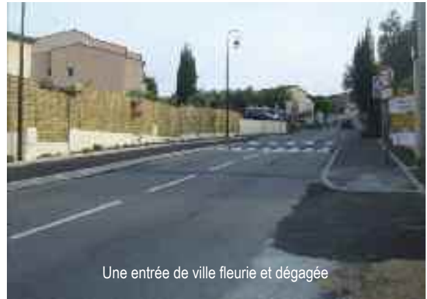
Une entrée de ville fleurie et dégagée

La municipalité a profité de cet aménagement de sécurité pour prévoir des jardinières dotées de plantations avec paillage, qui embellissent l'entrée de notre village enfin dégagée.