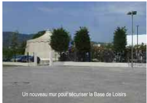
Un nouveau mur pour sécuriser la Base de Loisirs