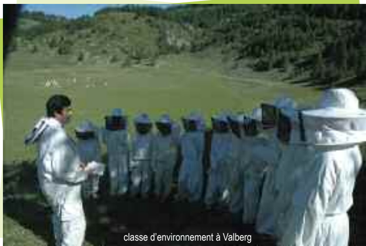
classe d'environnement à Valberg