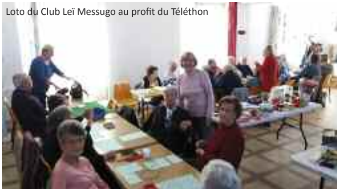
Loto du Club Leï Messugo au profit du Téléthon

Un grand bravo à l'association Roquettons ensemble et aux bénévoles !