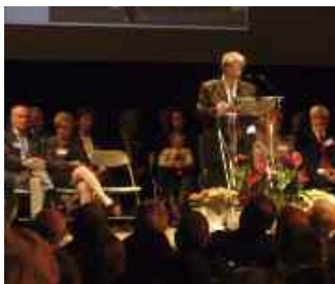
Voeux du maire

Bulletin municipal de la commune de La Roquette-sur-Siagne