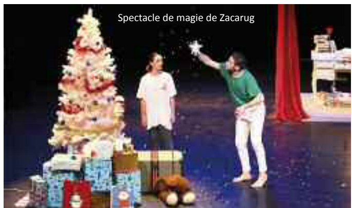
Spectacle de magie de Zacarug