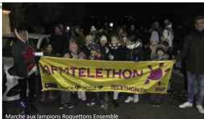
Marche aux lampions Roquettons Ensemble