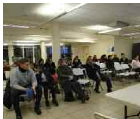
Les rythmes scolaires