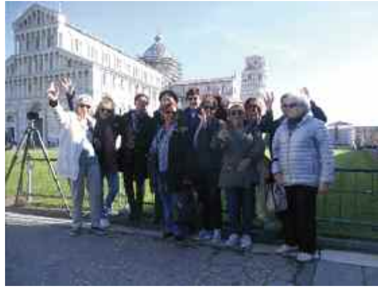
Novembre - Club Leï Messugo - Escapade en Toscane et découverte pour dix adhérents des villes de Florence et de Pise.