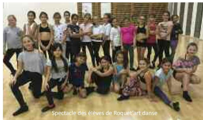
Spectacle des élèves de Roquet'art danse