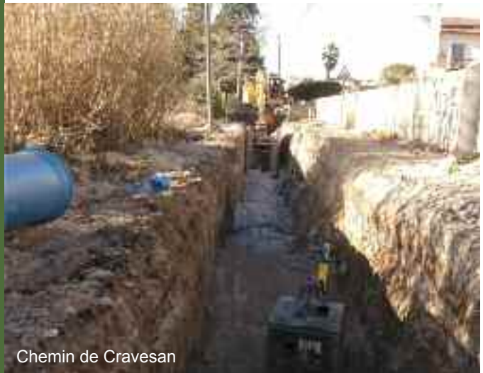
Chemin de Cravesan

Deux regards d'eau usée détériorés qui causaient de fortes odeurs et une pollution des sols ont été rénovés.