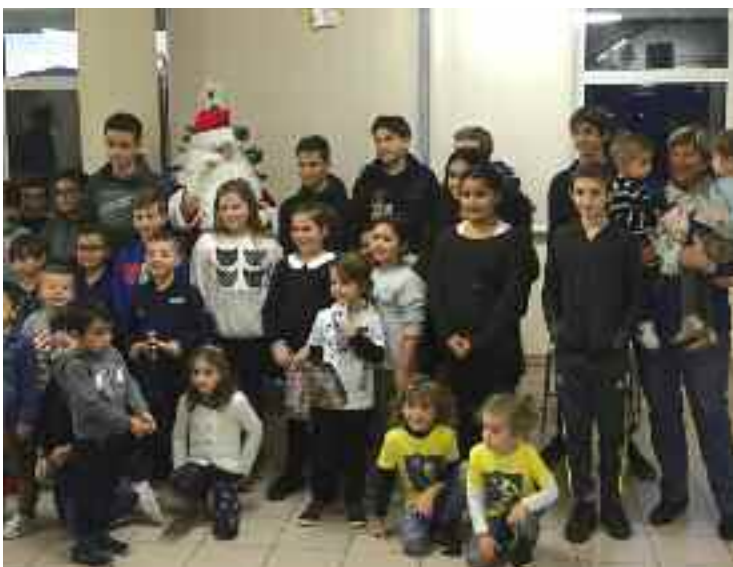
Noël des enfants du personnel municipal.