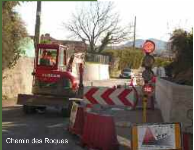
Chemin des Roques