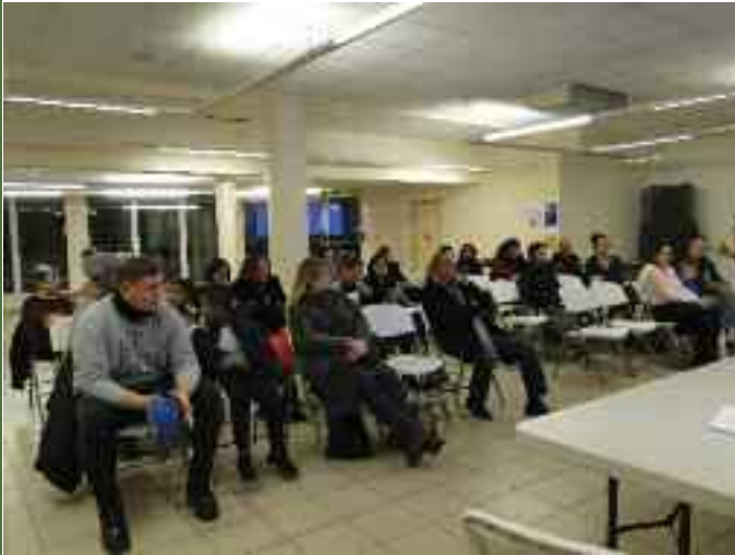
Réunion sur les rythmes scolaires du 30 novembre 2017