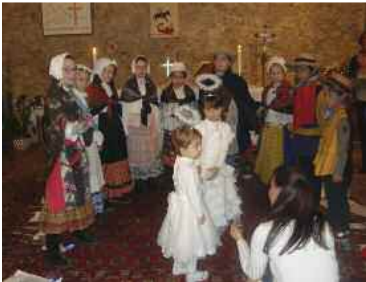
24 décembre - Veillée de Noël avec les enfants du catéchisme.