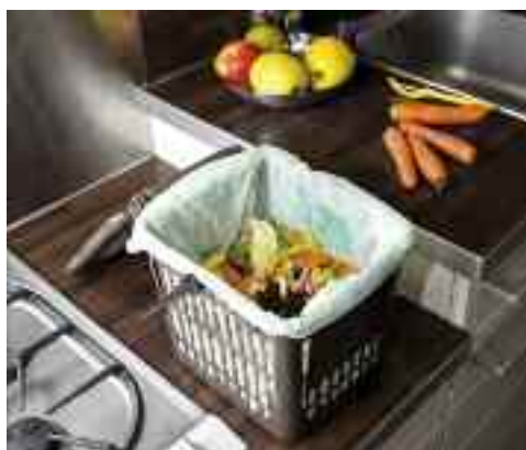
Déchets : informez-vous !